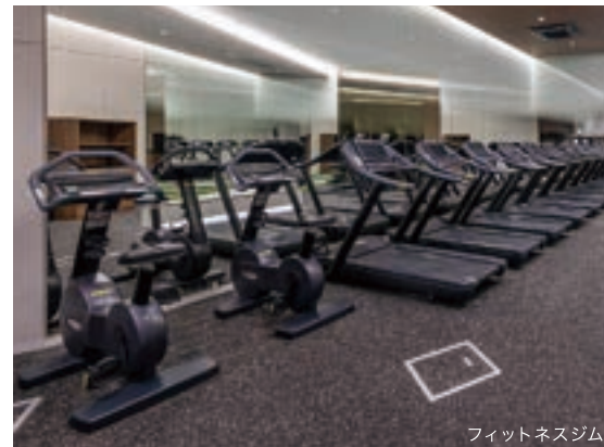
フィットネスジム