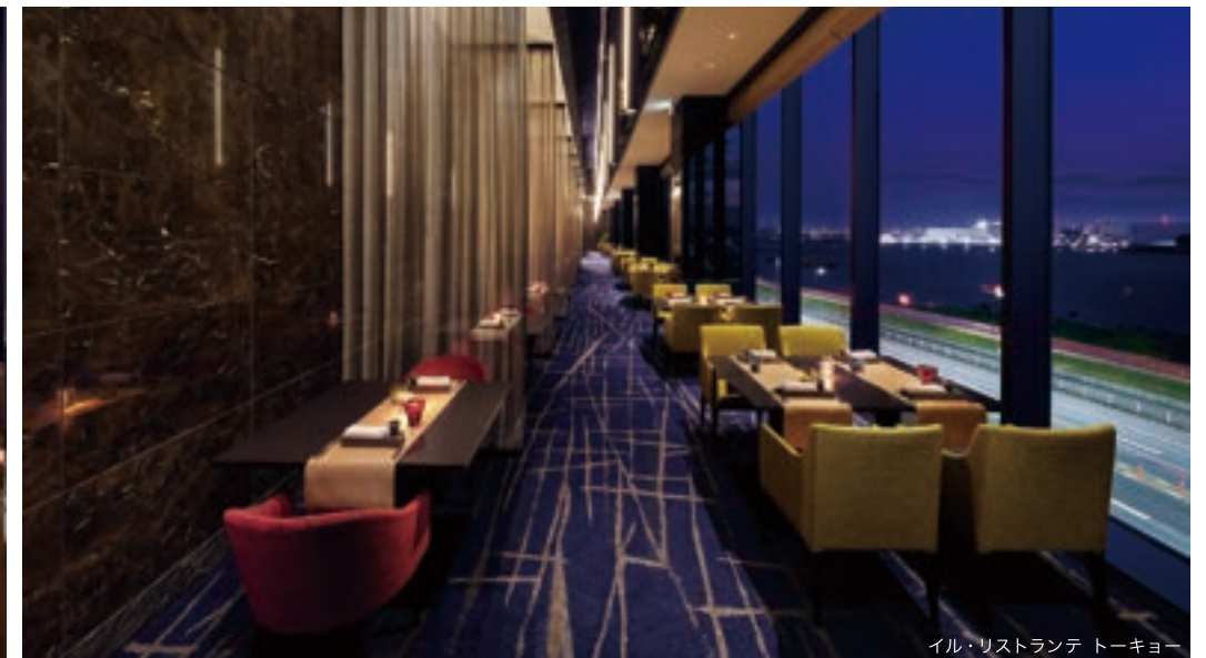
イル・リストランテ トーキョー