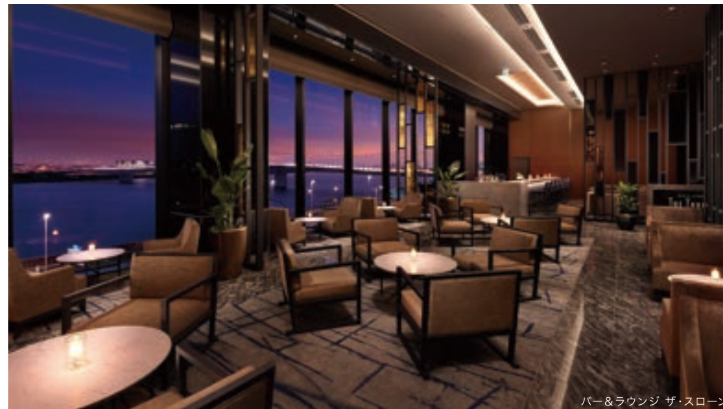
バー&ラウンジ ザ・スローン

館内には『ELLE SPA』を併設し、心身を解きほぐすラグジュアリーなウェルネス体験をご提供いたします。